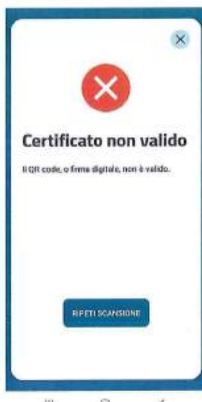
Figura 6 Schermate Verifica C19 - QR code non validato per formato errato o firma non valida