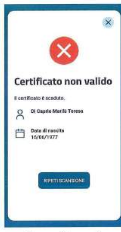
Figura 7 Schermate Verifica C19 - QR code validato correttamente ma scaduto