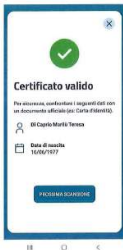
Figura 5 Schermate Verifica C19 - messaggio di conferma per QR code validato correttamente.