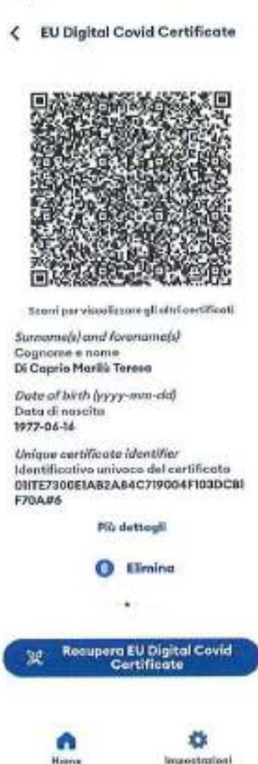
Figura 9 Schermata app Immuni - visualizzazione certificazione verde COVID-19

Nelle figure 9 e 19 viene mostrato come l'utente visualizza la propria certificazione nelle app.