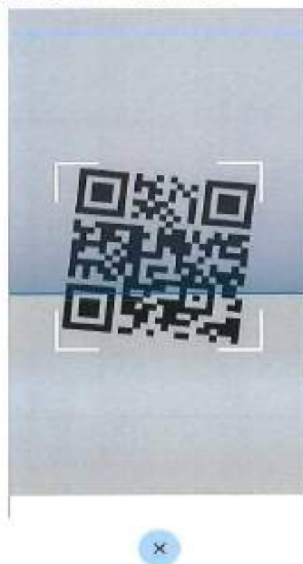
Figura 3 Schermate Verifica C19 - scansione di un QR code