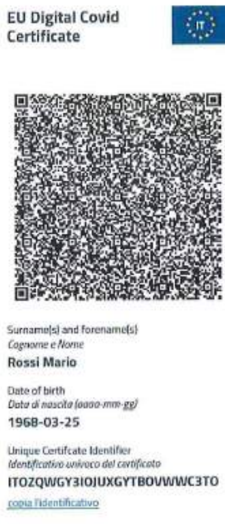
Figura 10 Schermata app IO - visualizzazione certificazione verde COVID-19