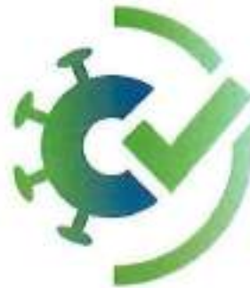
Figura 1 Logo della App ufficiale italiana VerificaC19 pubblicata dal Ministero della Salute

La App VerificaC19 permette agli operatori di verificare il QR code associato alla Certificazione verde COVID-19 di una persona anche in modalità offline, ovvero senza la necessità di una connessione internet, e non prevede la memorizzazione dei dati sensibili del cittadino sul dispositivo mobile del verificatore o l'inoltro di informazioni verso terzi.