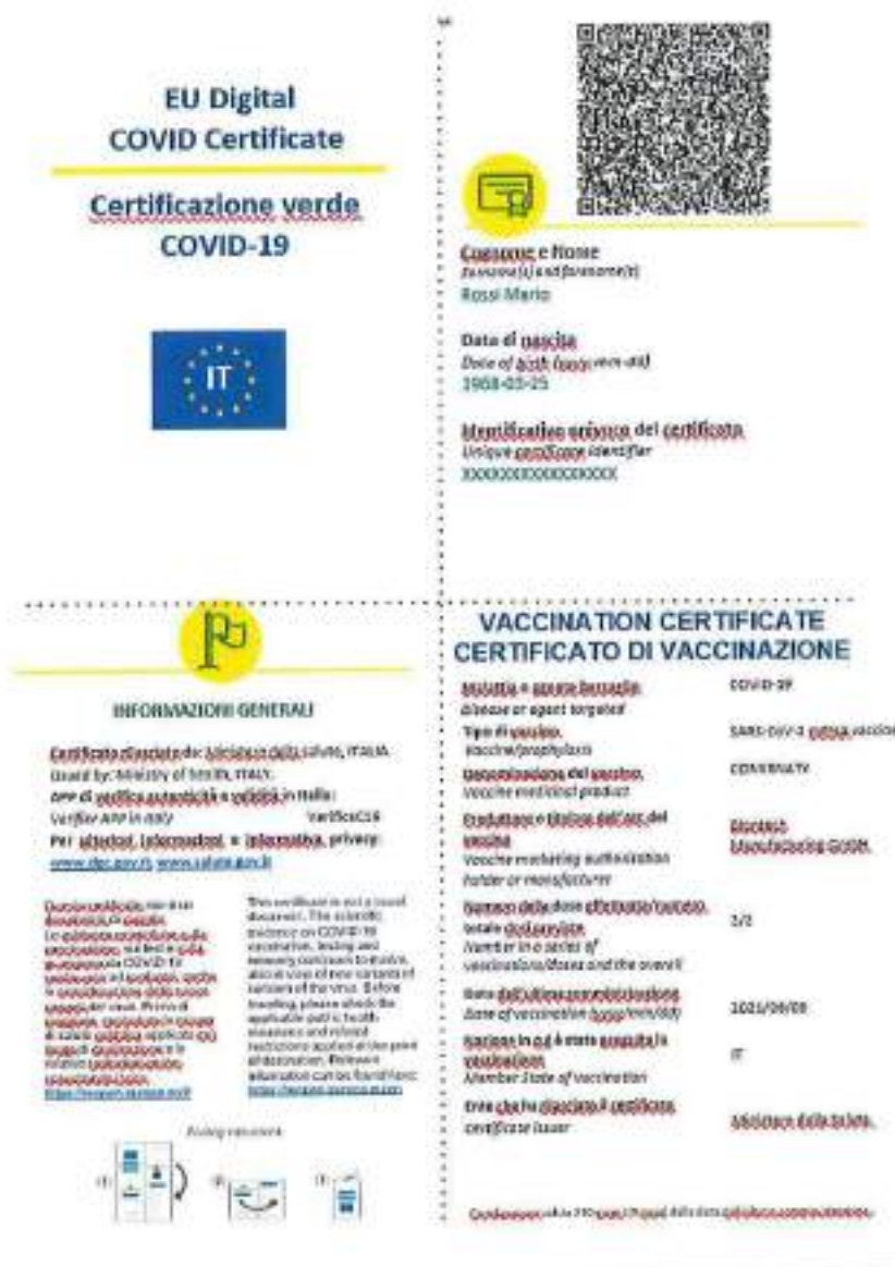
5. Figura 8 Facsimile della stampa cartacea della Certificazione verde COVID-19 per vaccinazione NELLE APP IMMUNE E IO

La figura di seguito mostra un facsimile della stampa in formato A4: