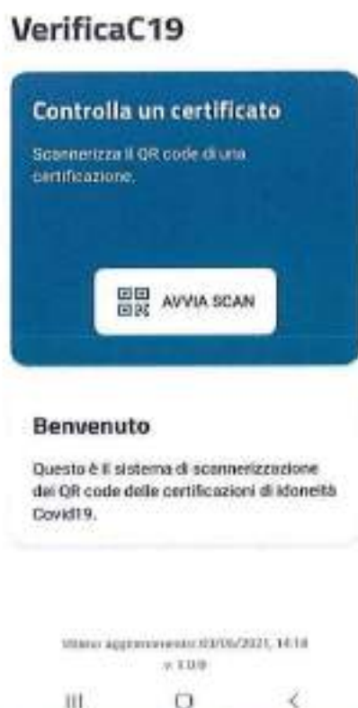
Figura 4 Schermate Verifica C19 - Home

Nelle figure seguenti vengono mostrate le schermate principali di VerificaC19